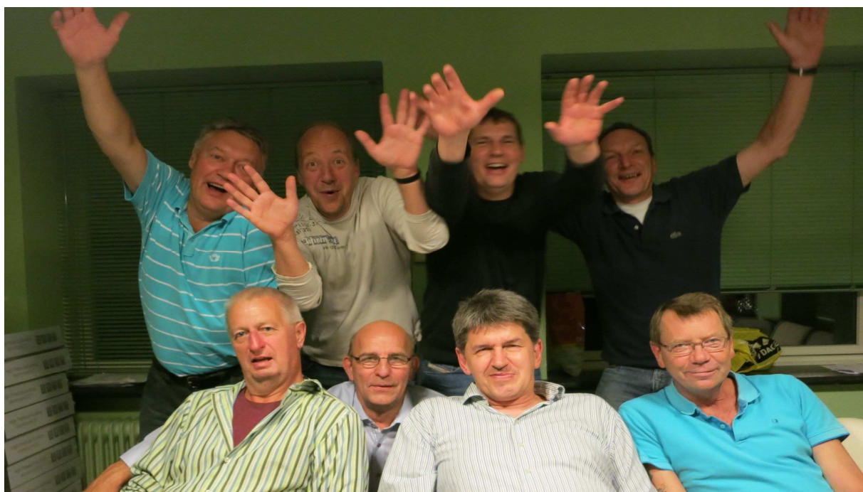
Glade TIKKERE ved afslutningsfesten