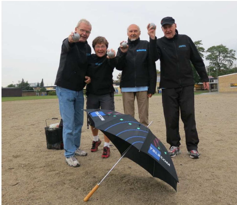
Hvor er grisen?