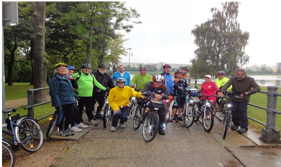
Øverst, Tour København cykling, Midten Oscar i Dijon , Nederst Oder-Neisse cykling Tjekkiet